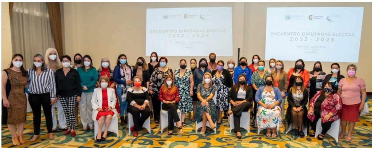
Costa Rica- Encuentro Diputadas electas, año 2022.