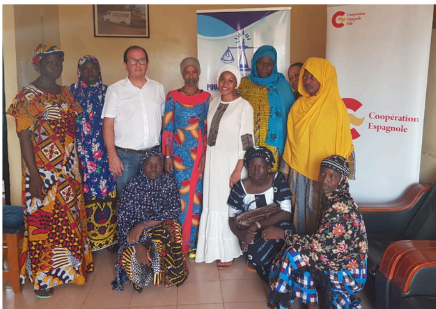
Mali. Encuentro de referentes de AECID con las beneficiarias del proyecto.

También se pudo constatar como las mujeres han reforzado sus capacidades en liderazgo y en la gestión de la salud emocional y son más conscientes de la necesidad de organizar diálogos en las comunidades afectadas y del papel que les corresponde en la resolución de conflictos.