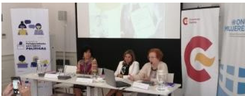
Uruguay, "Apoyo a la creación y puesta en marcha de un centro de formación para mujeres políticas uruguayas" con ONU Mujeres.

En conclusión, el proyecto ha sido un éxito en términos de alcanzar sus objetivos y de generar un impacto positivo en el empoderamiento de las mujeres líderes políticas en Uruguay. Los resultados obtenidos demuestran la necesidad de continuar invirtiendo en programas de formación y capacitación dirigidos a las mujeres, con el fin de promover una mayor igualdad de género en la representación política.