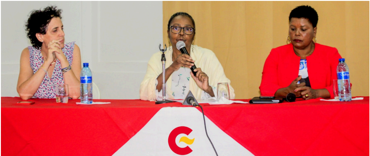
Haiti. FENAFEMH, Presentación de "Agenda Política de las Mujeres". 2023.

Con apoyo del Programa Ellas+ 2021 de la AECID, la Federación Nacional de Alcaldesas de Haití (FENAFEMH) presentó la "Agenda Política de las Mujeres", elaborada con la participación de más de cuarenta organizaciones de mujeres y feministas. Este documento estratégico incluye un "Plan de Incidencia Política" y un "Plan de Comunicación", destinado a fortalecer el papel de las alcaldesas en el desarrollo local y alentar a las mujeres a participar en la vida política.