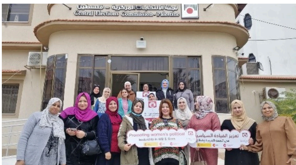
Palestina. “Promoción del liderazgo político de las mujeres en Cisjordania y Gaza” financiado por la Cooperación Española.

Entre los logros del proyecto, se incluyen reuniones introductorias, formación de cuatro grupos de mujeres y jóvenes líderes, y realización de talleres y estudios. También se han implementado campañas mediáticas y diez iniciativas para mejorar el liderazgo político de las mujeres. Además, se llevaron a cabo visitas educativas y se publicaron las actividades del proyecto en redes sociales, alcanzando una amplia audiencia. El proyecto ha tenido un impacto significativo en la promoción del liderazgo político y la participación de las mujeres en Palestina, a pesar de los numerosos obstáculos enfrentados.