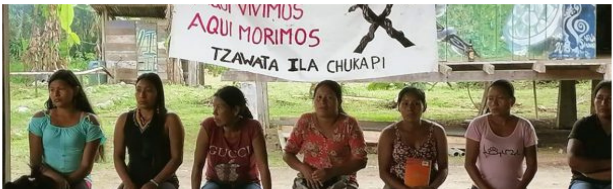
Ecuador. "Mujeres indígenas promoviendo en clave intercultural la construcción del Estado plurinacional"

El proyecto "Mujeres indígenas promoviendo en clave intercultural la construcción del Estado plurinacional" comenzó en enero de 2022, con dos desembolsos económicos que totalizaron 100.000 euros. Estos fondos permitieron ejecutar diversas actividades y adquirir equipos necesarios para la realización del proyecto, que buscó empoderar a las mujeres indígenas y promover su participación en la construcción de un Estado plurinacional en Ecuador.