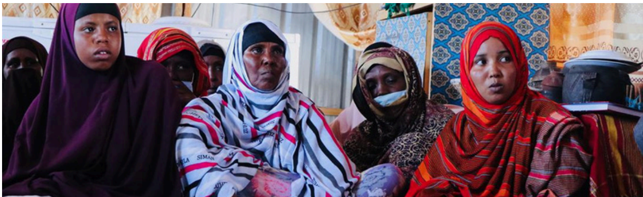
Etiopía. “Participación política y liderazgo de mujeres jóvenes desde el feminismo etíope”

Gracias a la subvención recibida de la AECID, la ONG etíope Setaweet implementó el proyecto “Participación política y liderazgo de mujeres jóvenes desde el feminismo etíope” orientado a promover la participación plena y efectiva de las mujeres y la igualdad de oportunidades de liderazgo en todos los niveles de toma de decisiones en la vida política y pública de Etiopía, con un enfoque especial en la educación y la prevención de la violencia.