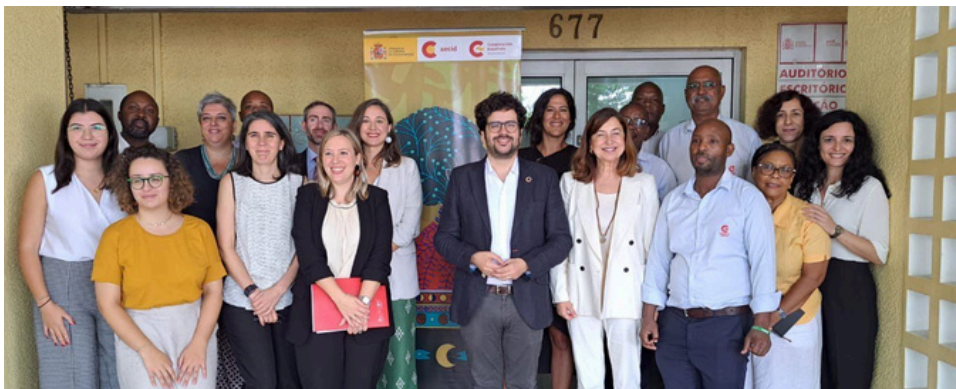
Mozambique. Proyecto de Fortalecimiento de la Participación de las Mujeres en los Espacios de Decisión en la Vida Política y Pública en Cabo Delgado"

Adicionalmente, se identificaron y enfrentaron desafíos en la ejecución presupuestaria y la planificación de actividades, lo que llevó a una reprogramación para las fases II y III del proyecto. Se hizo especial hincapié en el distrito de Chiure, ajustando las actividades para asegurar una mayor eficacia y alineación con las necesidades locales. En conjunto, estos esfuerzos han sentado las bases para una participación más inclusiva y efectiva de las mujeres en los procesos de toma de decisiones en Cabo Delgado.