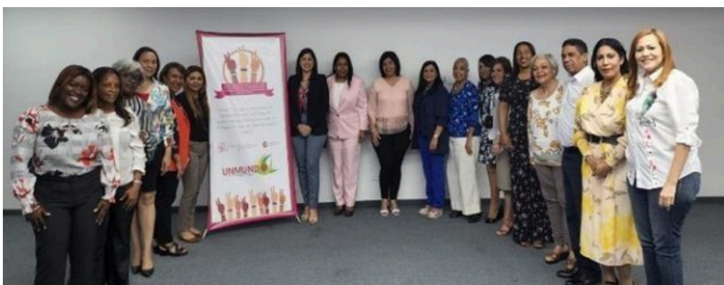
República Dominicana. "Articulación de procesos de incidencia desde la Unión de Mujeres Municipalistas Dominicanas (UNMUNDO) y construcción de Liderazgos en todos los niveles del ámbito político".

Además, el proyecto incluyó un seminario internacional sobre violencia política hacia las mujeres y la contratación de consultorías para identificar las barreras que enfrentan las mujeres en la política y proponer estrategias para superarlas. Los resultados esperados fueron alcanzados, incluyendo la capacitación y empoderamiento de mujeres políticas y comunitarias, la incidencia en la modificación de leyes para favorecer la paridad, y la creación de alianzas estratégicas con la cámara de diputados y el senado.