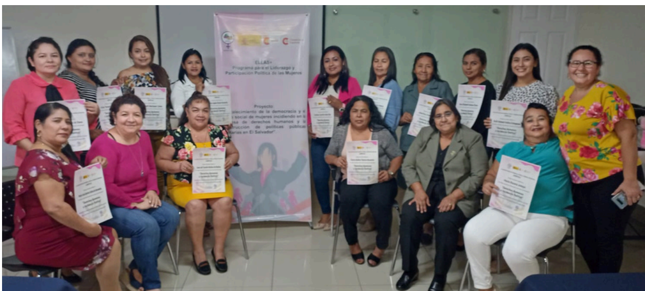
El Salvador. "Fortaleciendo la democracia y el tejido social de mujeres incidiendo en la defensa de derechos humanos y la construcción de políticas públicas paritarias"

En resumen, el proyecto ha logrado avances significativos en el empoderamiento de las mujeres salvadoreñas y en la construcción de una sociedad más justa e igualitaria.