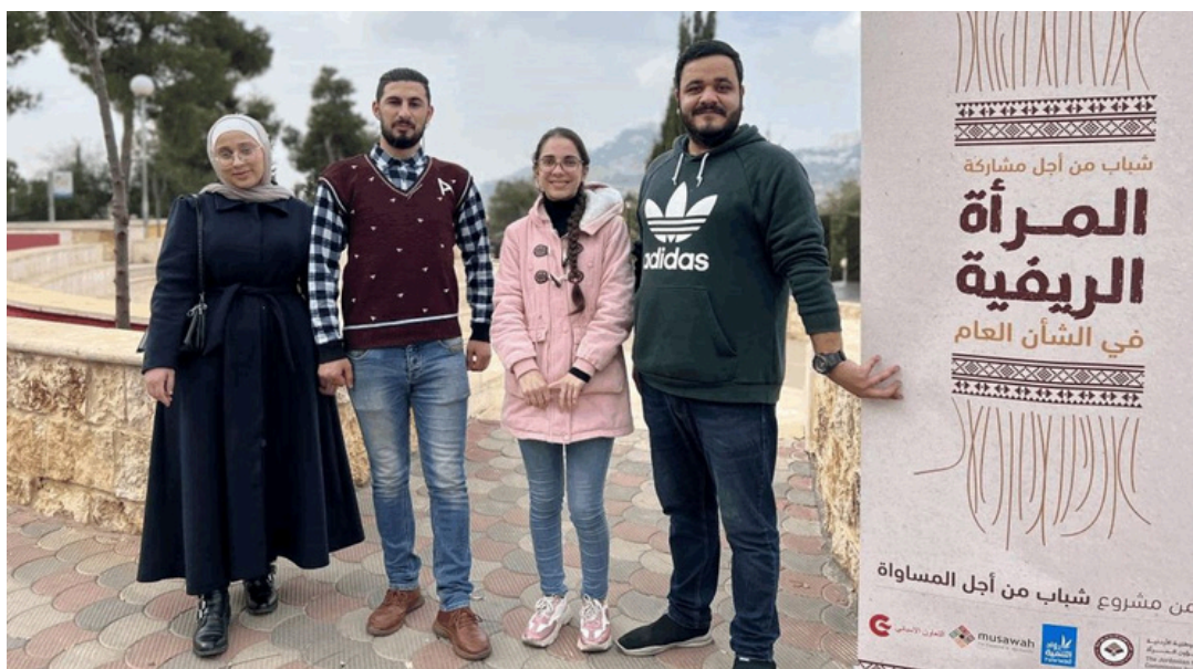
Jordania. "Movilizando a la Juventud por la Igualdad de Género"

Entre los logros destacan el desarrollo de un Manual del Programa de Capacitación de Jóvenes Feministas y la formación de un Grupo Central de Jóvenes capacitado para cuestionar normas en apoyo de la igualdad de género. Además, se implementaron iniciativas locales y se proporcionó asesoramiento a grupos juveniles. Estos esfuerzos culminaron en la nominación de un joven del grupo para representar a Jordania en la Organización Árabe de Mujeres.