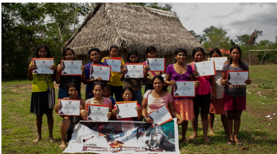
Perú. “Promoción de la participación de las mujeres indígenas en Perú”

Además, se realizaron actividades de sensibilización y formación en las comunidades, destacándose la Escuela de Participación Política. Esta iniciativa permitió que las mujeres participantes fortalecieran su conocimiento sobre sus derechos individuales y colectivos, así como su derecho a la participación política. A pesar de algunos obstáculos logísticos, las actividades alcanzaron sus objetivos, promoviendo un diálogo significativo sobre la importancia de la participación política de las mujeres indígenas y empoderándolas para asumir roles de liderazgo en sus comunidades.