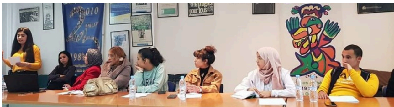
Marruecos - Mesa redonda sobre la Efectividad de la Igualdad para un Desarrollo Sostenible