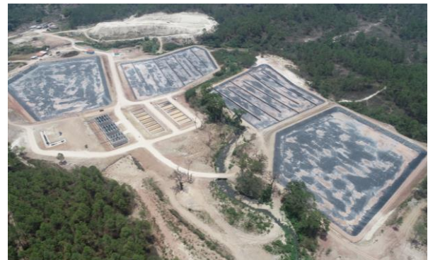
Fotografía 4: Vista aérea de las obras de la Planta de Tratamiento de Aguas Residuales (2019).