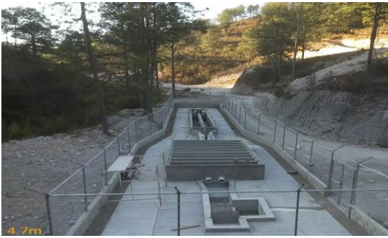
Fotografía 1: Imagen de Pretratamiento Norte finalizado (2019).