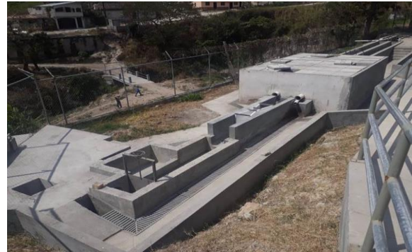
Fotografía 2: Imagen del Pretratamiento Sur finalizado (2019).