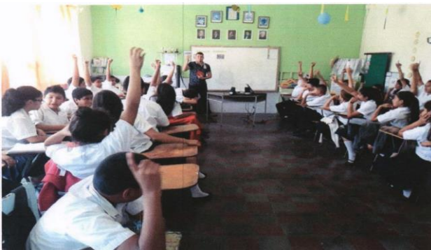
Fotografía 3: Imagen de campaña de sensibilización del Programa Construcción del Plan Maestro (Director) de Alcantarillado Sanitario de Santa Rosa de Copán impartida por ADELSAR (2019).