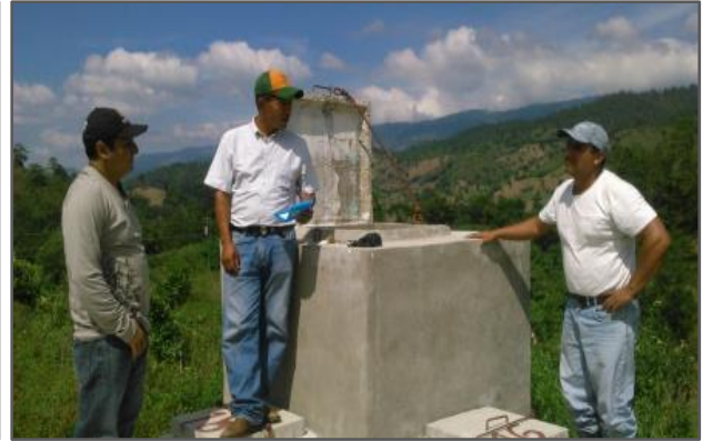
Fotografía 2: Monitoreo a fontaneros de proyecto el Coco, San Juan Ermita