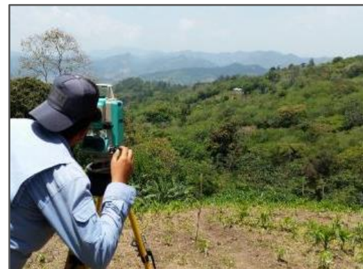
Fotografía 4: Topografía proyecto Caserío Nueva Esperanza