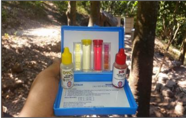
Fotografía 1: Seguimiento de cloración para proyecto el Coco, San Juan Ermita