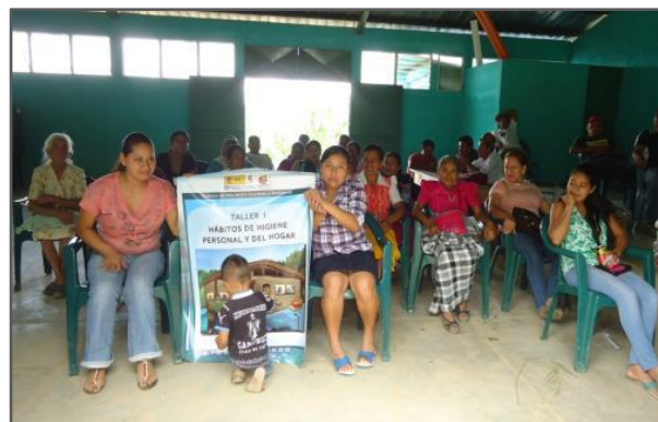
Fotografía 5: Implementación de Talleres sobre higiene personal, limpieza del hogar y métodos de desinfección y purificación del agua, dirigido a beneficiarios de los sistemas. Aldea Piedra de Amolar Olopa