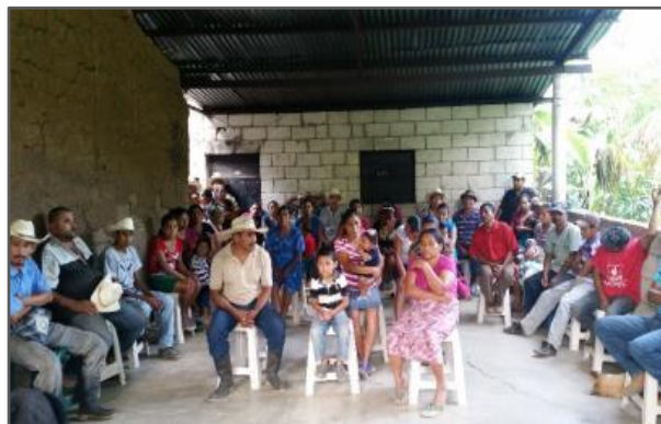
Fotografía 3: Socialización del tipo de letrina a instalar Caserío Nueva Esperanza