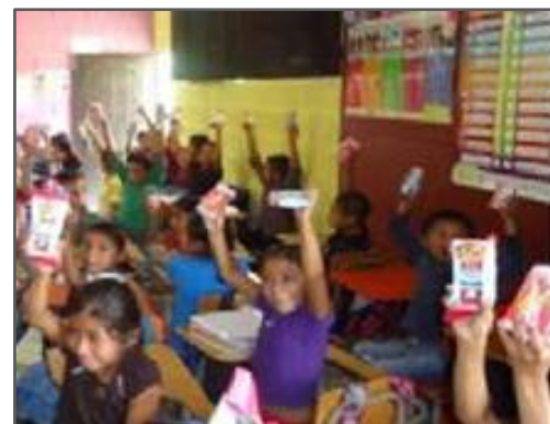
Fotografía 6: Implementación de charlas de sensibilización sobre hábitos higiénicos, como parte de la implementación de la metodología SHE. En centros educativos. Centros educativos de la Aldea Tuticopote, Olopa.